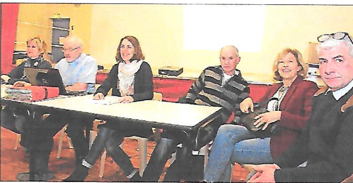
Les membres du bureau développent les activités de l'association.