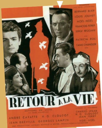
" RETOUR A LA VIE " 1949

" C'est par le jeu des rencontres qu'une carrière se crée et avance. Le théâtre puis le cinéma sont intimement liés à ceux qui m'ont fait confiance : Jean Cocteau, Marcel Carné, Jean Paul Sartre, Jacques Becker, Jean Pierre Melville... Pour le reste, tout dépend de soi, de la force de sa volonté. "