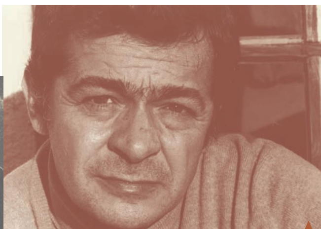
UNE DES PREMIERES PHOTOS EN 1966