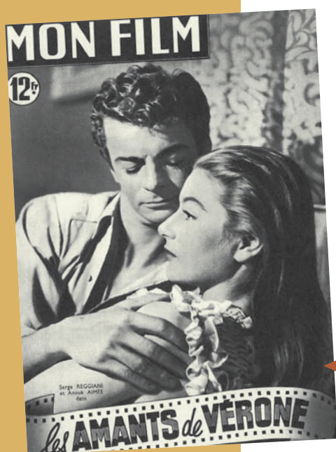
LA UNE DE " MON FILM " EN 1949