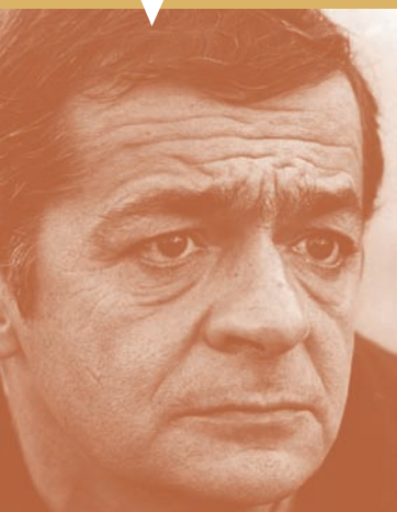
SERGE REGGIANI. UN REGARD. UNE "GUEULE". DU CINEMA FRANCAIS