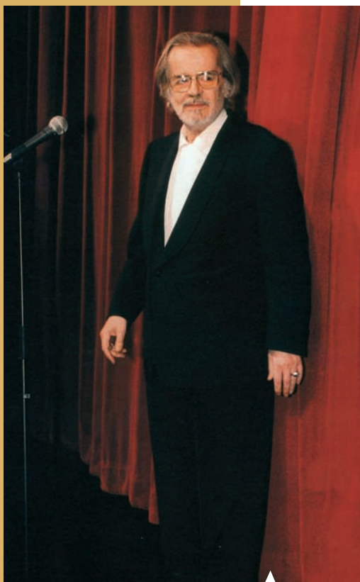
SERGE REGGIANI A L'OLYMPIA EN 1995 DEVANT LE MYTHIQUE RIDEAU ROUGE

" Sur scène, il restituait ce qu'il ressentait avec une parfaite connaissance de ses possibilités " (Georges Moustaki)