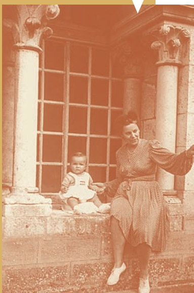
LE PETIT SERGIO ET SA MAMAN