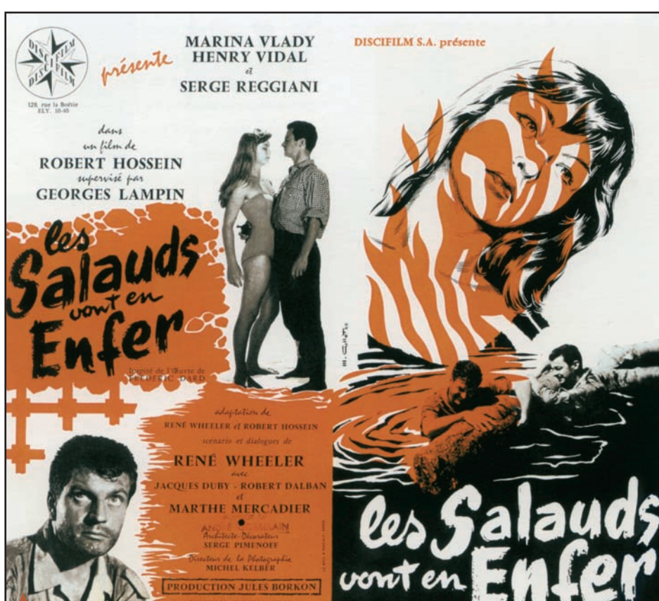
" LES SALAUDS VONT EN ENFER " 1955